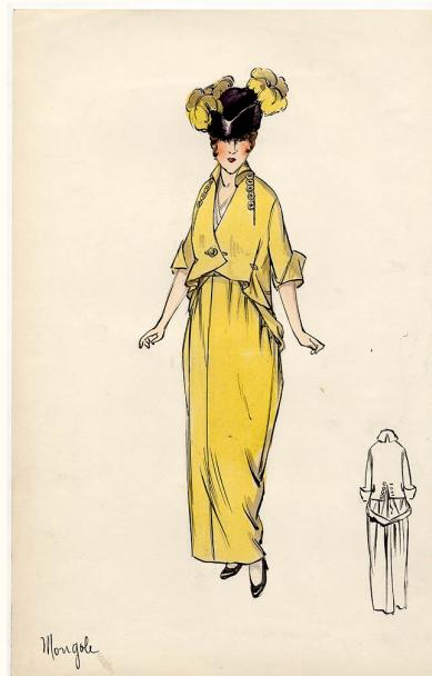
22. Bernard & Cie., Mongole , 1914

Disegno originale. Tempera e china su cartoncino, 32,5x20,5 cm.