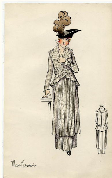
21. Bernard & Cie., Marc Twain , 1914

Disegno originale. Tempera e china su cartoncino, 32x20,5 cm.