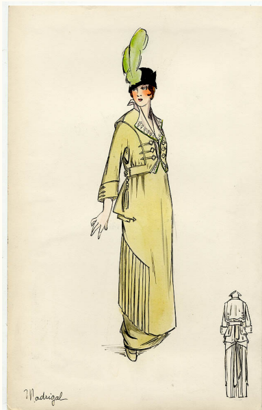
20. Bernard & Cie., Madrigal , 1914

Disegno originale. Tempera e china su cartoncino, 32x20,5 cm.