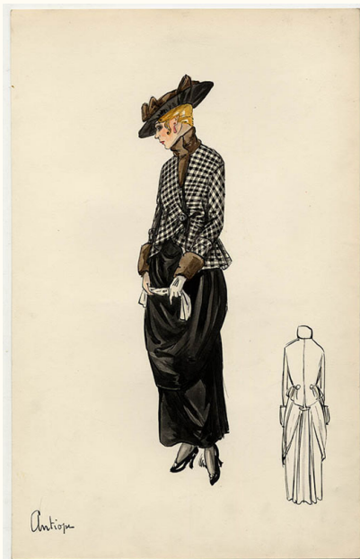
19. Bernard & Cie., Antiope , 1914

Disegno originale. Tempera e china su cartoncino, 32x20,5 cm.